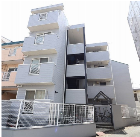
[外観・現況][外観写真]掲載写真は全て前入居者ご入居前に撮影

■西鉄雑餉隈駅 徒歩10分、J R 笹原駅徒歩15分 Wアクセス、小型犬可 J-COM インターネット利用料無料! WiFi40Mプラン&CS放送6Ch無料プラン