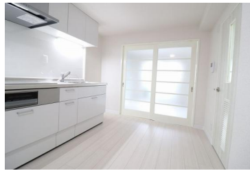
[専用部・室内写真][ダイニングキッチン]