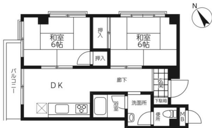
[間取り図・図面][間取り図]